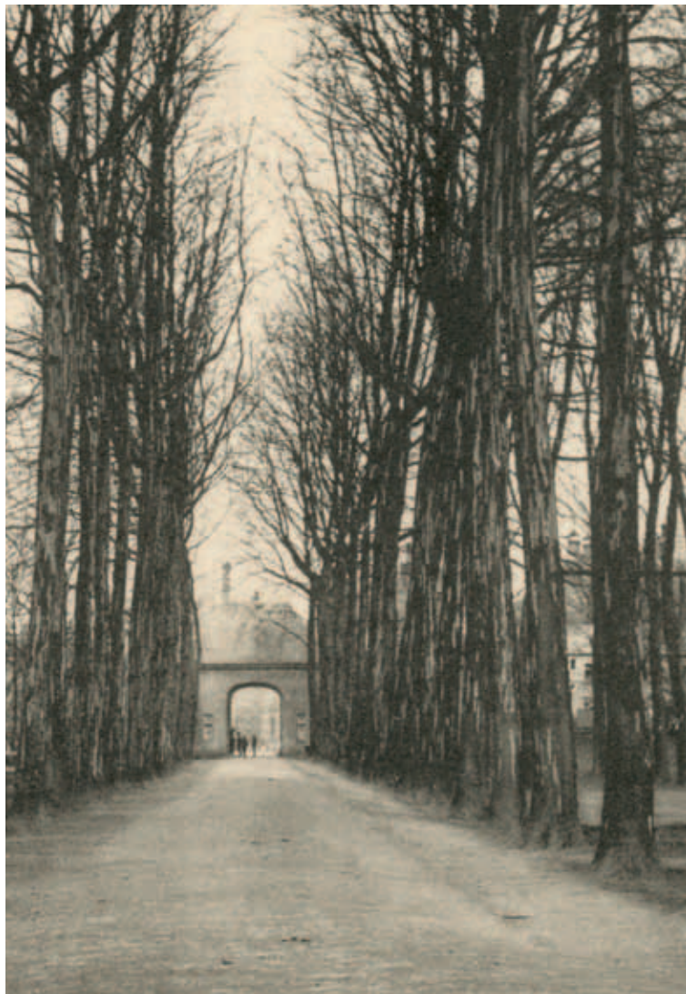
De Kasteellaan, gezien in de richting van de Veestraat. Op de achtergrond de in 1959 gesloopte kasteelpoort.