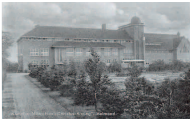
In het missiehuis Christus Koning aan de Deurnesweg zijn honderden jonge mannen klaargestoomd voor het 'missiewerk'.

In ieder huis hing een kruisje boven de deur, een wijwaterbakje aan de muur en een Mariabeeldje op het dressoir, of een beeldje van een andere favoriete heilige. Velen denken met nostalgie aan hun eerste H. Communie, de jeugdijaren als misdienaar of lid van de scouting. En wie herinnert zich niet de kruisweg op Goede Vrijdag, het askruisje, de vastentijd en de catechismus. Het aantal geestelijken steeg tussen 1920