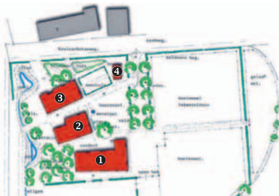
Toekomstige situatie van het gebied Cleen Eijndt. ① Woonboerderij. ② Vakwerkboerderij. ③ Stamhuis. ④ Bakhuis. (Bestek BRO)

De vergaande plannen beginnen vorm te krijgen, al kan het project niet bancair worden gefinancierd. Om het te kunnen bekostigen wordt naar alter-