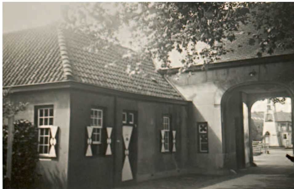
De kasteelpoort gezien in de richting van de Veestraatbrug. Links het gedeelte wat jarenlang in gebruik was als kantoor van notaris Keulen.

In 1937 was de poort onderwerp van gesprek tijdens een raadsvergadering. Het woongedeelte werd destijds verhuurd aan de tuinman, maar vanwege de vochtige staat waarin het verkeerde, was dat niet langer gewenst. Het college van