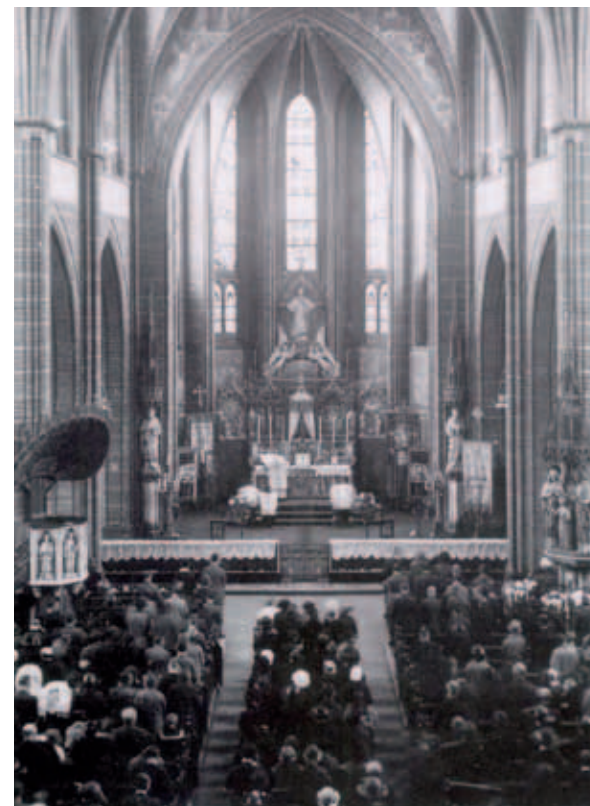
Overvolle kerken waren een vertrouwd gezicht, zoals hier de Heilig Hartkerk in de Veestraat.

of er op tijd gezinsuitbreiding kwam. Op het grootseminarie werd in het laatste jaar les gegeven in seksualiteit. Vóór het trouwen gaf de pastoor dan ook bruidsonderricht, want de kennis over het gebied bezuiden de navel was bij de meeste mensen nagenoeg nihil. De raad van de pastoor was duidelijk: “Ge hoeft alleen maar op uw rug te liggen en uw benen op te trekken.” Eind jaren vijftig luistert de Brabander nog wel naar de pastoor, maar doet lang niet meer wat hij zegt en in de jaren zestig werd de eerste kerk gesloopt.