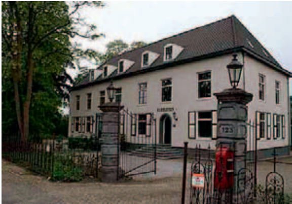
Karelstein werd na de brand in 1999 geheel gerenoveerd.

Erg succesvol was de onderneming niet. In 1887 toen de bedrijfspanden leeg stonden, vestigde Piet de Wit er de 'Bontgoederenfabriek Piet de Wit en Zoon' . Omdat het bedrijf meer kapitaal nodig had stak jonkheer Emile Wesselman van Helmond er 30.000 gulden in, een investering waar hij weinig van terug heeft gezien. Na Piet's verscheiden kwam de bedrijfsleiding in handen van zijn zoon Peter. Met nieuw kapitaal werd de 'Nederlandse Textielindustrie v/h Piet de Wit en Zn' opgericht met een maatschappelijk fortuin van 500 mille. Bij akte van 14 april 1898 werd de oprichting een feit en in datzelfde jaar was de nieuwe onderneming bedrijfsklaar. Het was een van de modernste weverijen van het land, waarover het dagblad De Telegraaf schreef: "Deze weverij is de eerste in ons land, die geheel elektrisch is ingericht" .