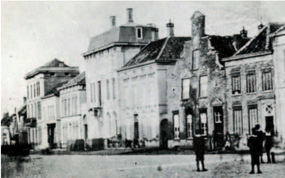
Op de plek van de voormalige bioscoop Centraal (het hoge pand) aan de oostzijde van de Markt, stond tot 1880 herberg 'Het Witte Paard'. Tweede huis van rechts is 'Het Hert'. (collectie RHCE)