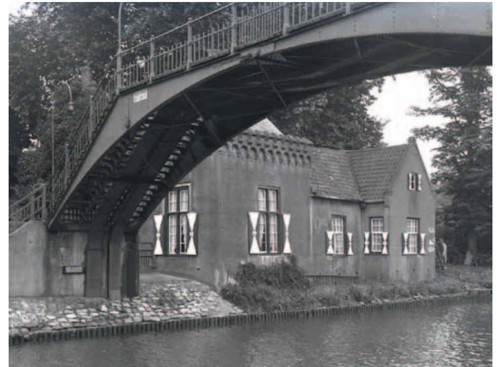
Zicht op de kasteelpoort vanaf het kanaal. Op de voorgrond de voetgangersbrug

burgemeester en wethouders wilde het pand verbouwen en enkel als kantoor verhuren. De raad vond de kosten echter te hoog en stelde: 'Het gebouw is nat en 't zal altijd een gepruts blijven, omdat het vocht van onder optrekt. Bovendien is het 'n leelijk ding' .